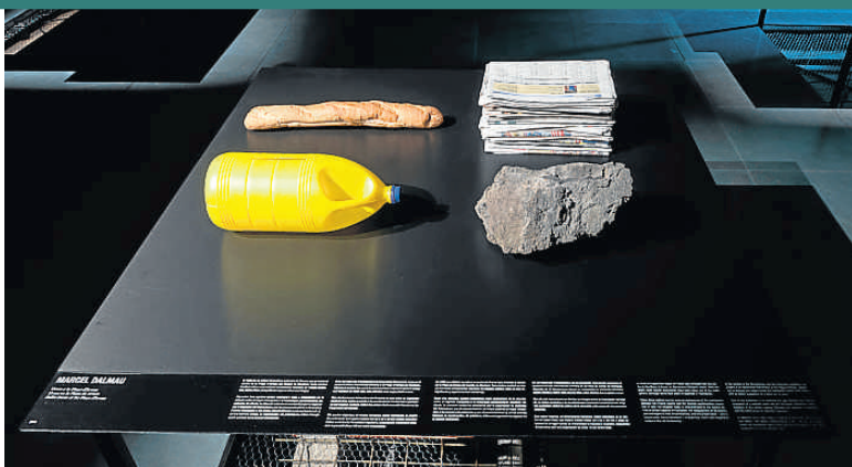
Marcel Dalmau: 'Urnes a la Plaça d'Armes', 2014

terial de todo tipo para ser divulgado. Una exposición que no nos marca un ritmo sino que sugiere, como el trabajo de estos artistas, perderse en múltiples lecturas, produciendo conexiones que a veces resultarán interesantes y otras fallarán, quedando radicalmente inconclusas . |