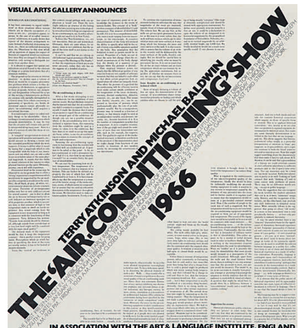
Art & Language: 'Poster for air-conditioning show', 1971-1972

terial de todo tipo para ser divulgado. Una exposición que no nos marca un ritmo sino que sugiere, como el trabajo de estos artistas, perderse en múltiples lecturas, produciendo conexiones que a veces resultarán interesantes y otras fallarán, quedando radicalmente inconclusas . |